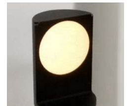
Fente \varnothing 14mm