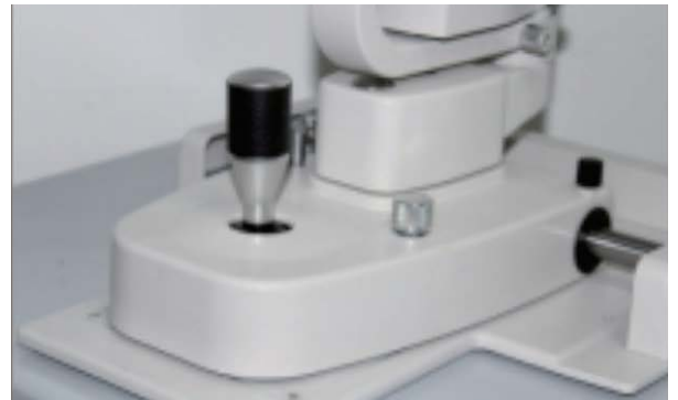
Eclairage variable en continu

5 grossissements Eclairage LED réglable en continu Variateur accessible pour opération à 1main Filtre jaune (contraste) inclus Tonomètre numérique en option