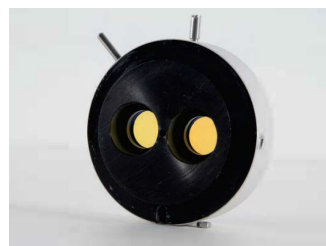
Filtre Jaune (contraste)